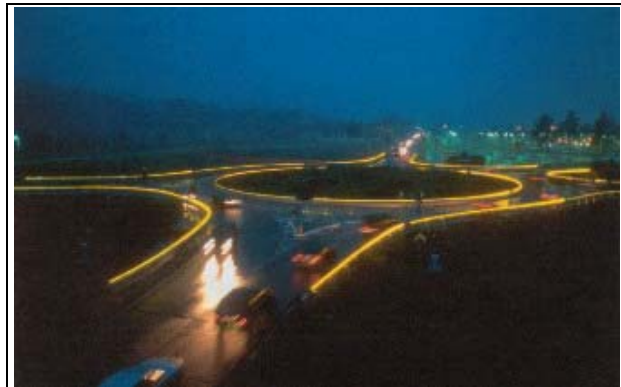
Serravalle Scrivia (AL) Rotonda Giovi

Nella circolazione notturna, un elemento che incide sul deterioramento delle acuità visive è il fenomeno provocato dall'abbagliamento delle goccioline d'acqua della nebbia. I raggi luminosi emessi dai fanali della macchina del guidatore ma anche da quelle che si incrociano, subiscono un fenomeno di riflessione, dispersione e assorbimento. Portano alla creazione di una luminanza di velo davanti agli occhi del guidatore - muro bianco