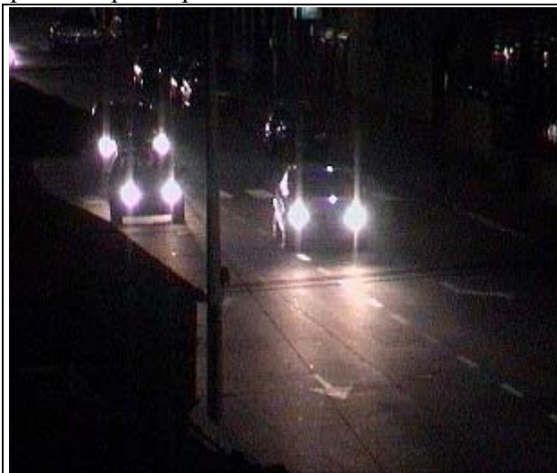
Immagine ripresa dal secondo piano di una abitazione

Altro problema che è stato rilevato riguarda l'altezza dei fari di alcune vetture cosiddette "fuoristrada" che però circolano liberamente all'interno delle città e sulle strade extraurbane. Hanno i fanali posti fino a 120 cm di altezza quindi superiori a quello dei lunotti posteriori di molte berline. Il risultato è che se si circola seguiti da una