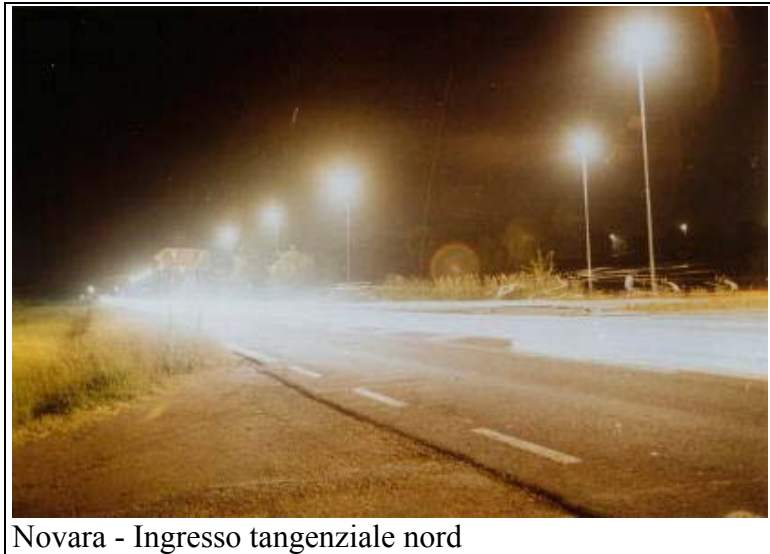
Novara - Ingresso tangenziale nord

Per le ragioni sopra dette, una strada a forte scorrimento con illuminamento di 2 candele al mq., se utilizza delle lampade completamente schermate permette di ottenere una visione di gran lunga superiore a quella degli impianti con lampade non schermate.