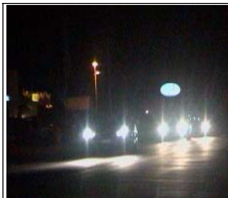
Normale situazione di abbagliamento. Si vede che i fari illuminano anche lo spazio vicino alle ruote dell'autovettura creando una doppia riflessione (quadrupla con i fendinebbia) che non dà nessun vantaggio per chi guida ma sono causa di ulteriori problemi per gli altri automobilisti